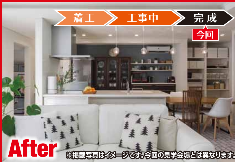
After ※掲載写真はイメージです。今回の見学会場とは異なります。