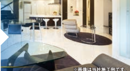
※画像は当社施工例です。