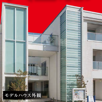
モデルハウス外観