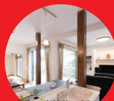
※画像は当社施工例です。