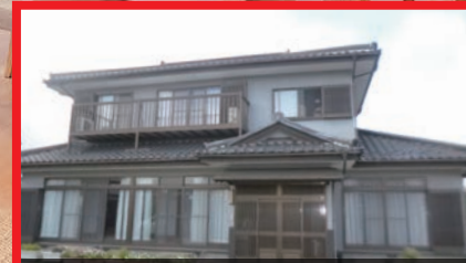
Before ※今回ご覧いただく会場の施工前写真です。