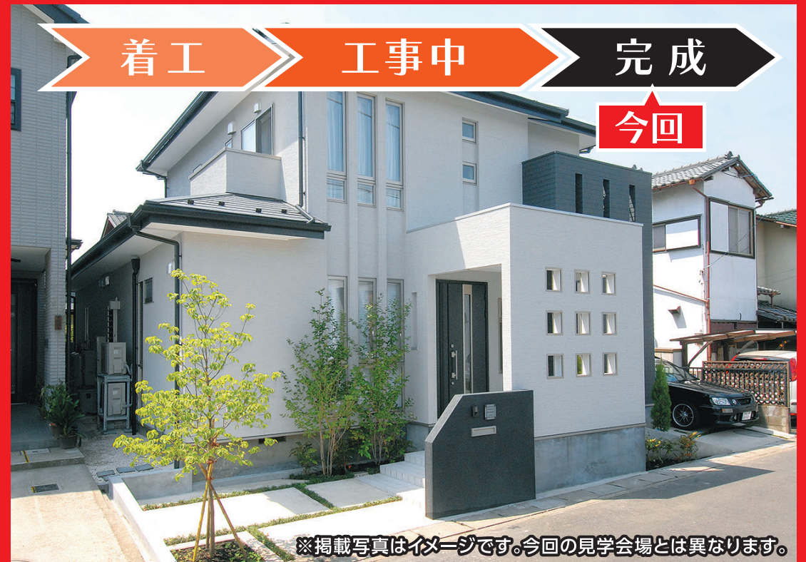
※掲載写真はイメージです。今回の見学会場とは異なります。