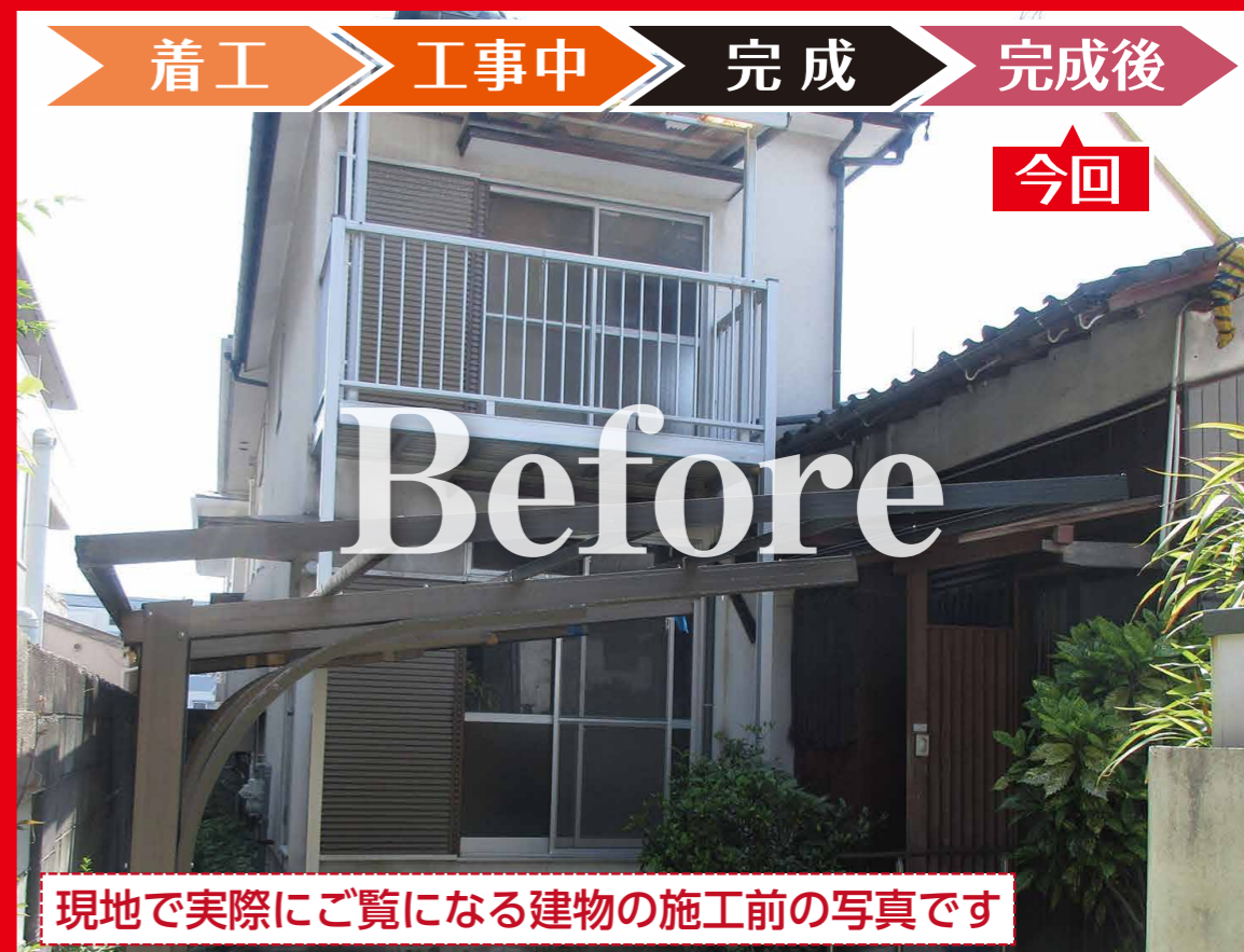
現地で実際にご覧になる建物の施工前の写真です