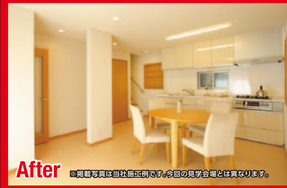
After ※掲載写真は当社施工例です。今回の見学会場とは異なります。