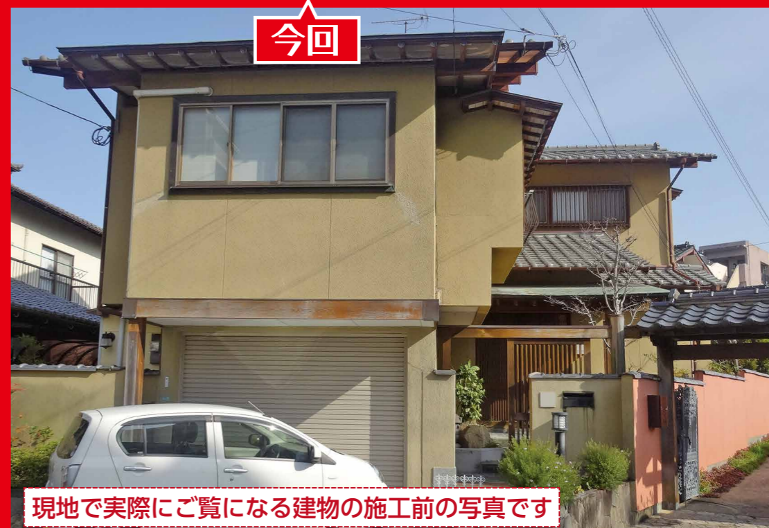
現地で実際にご覧になる建物の施工前の写真です