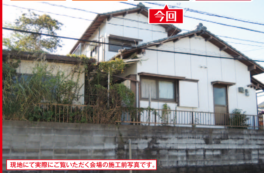
現地にて実際にご覧いただく会場の施工前写真です。