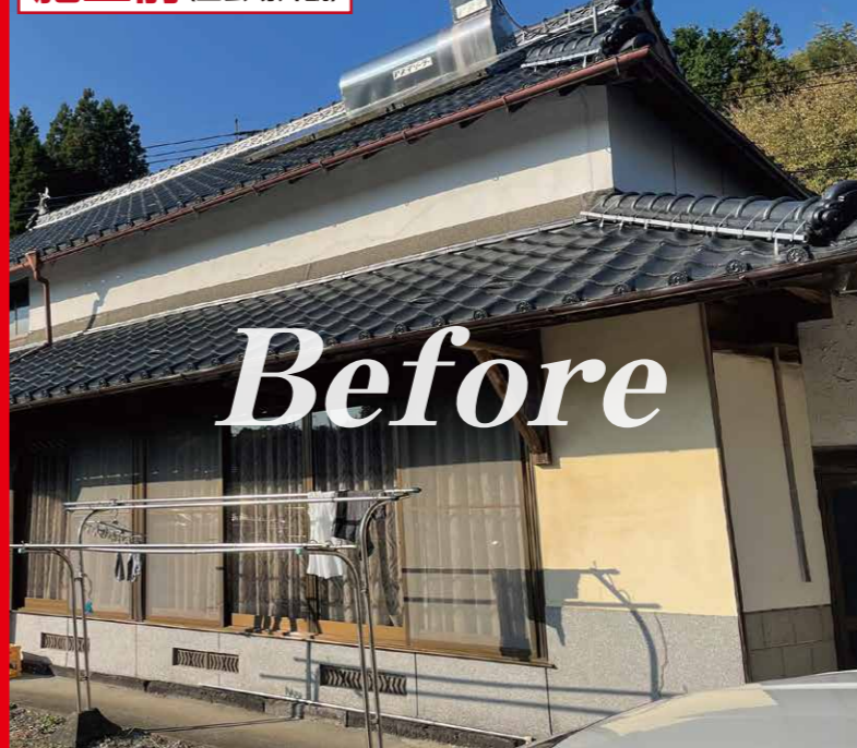
施工前 (当会場外観)