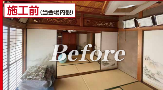
施工前 (当会場内観)