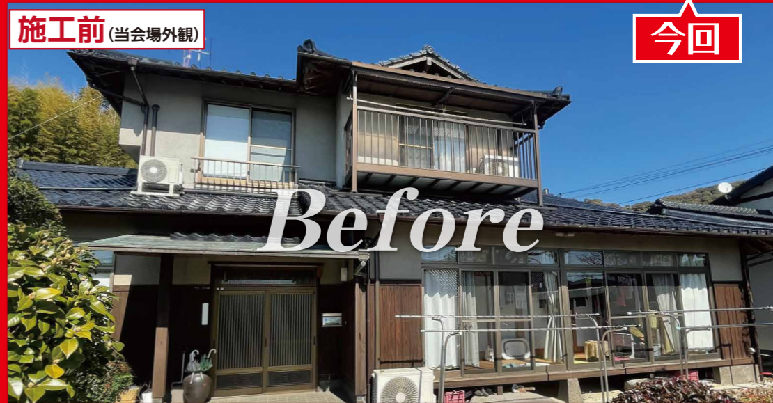
施工前 (当会場外観)