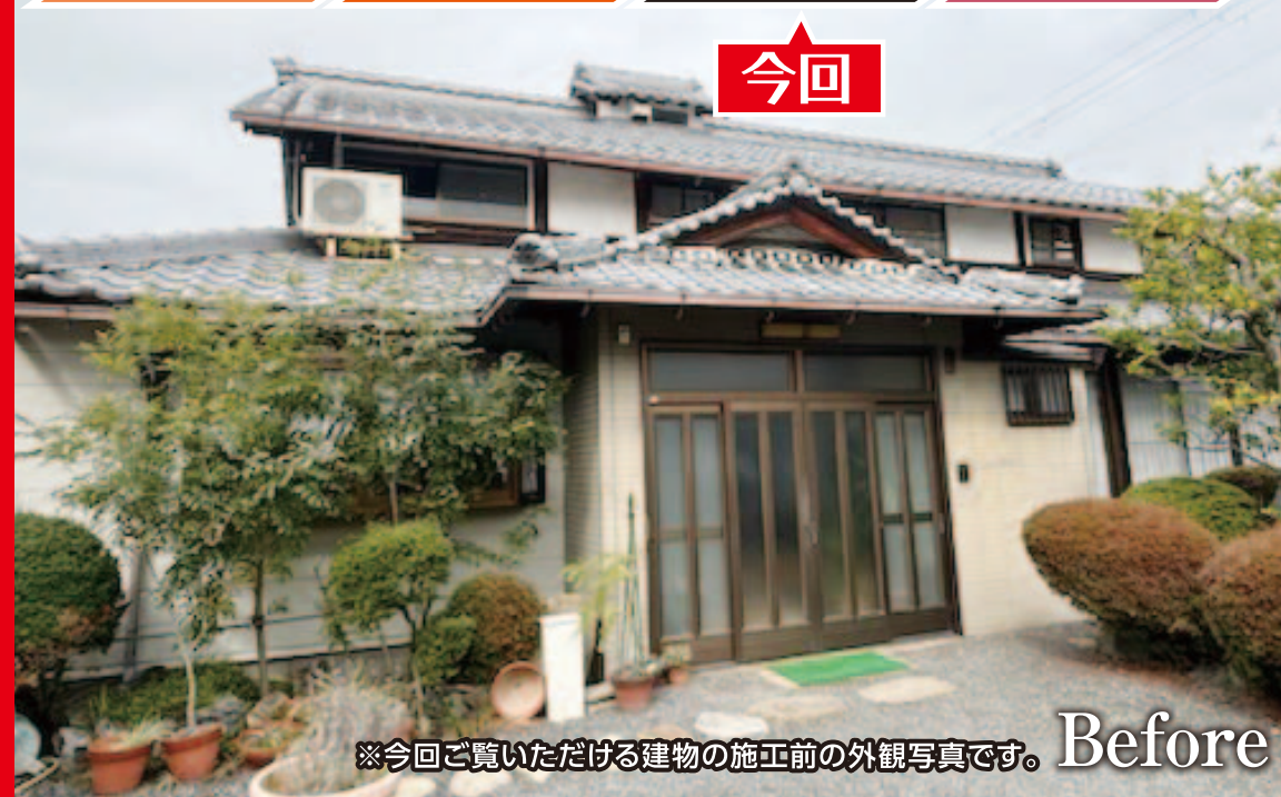
※今回ご覧いただける建物の施工前の外観写真です。 Before