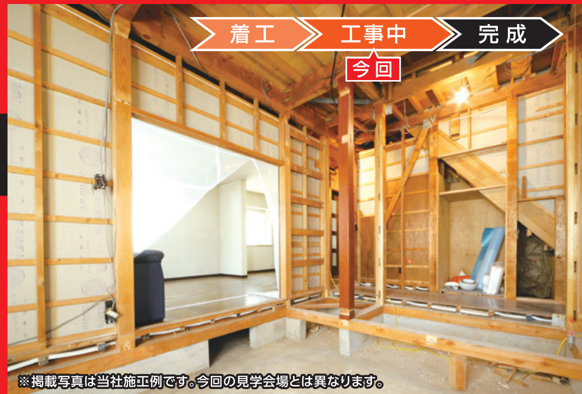
※掲載写真は当社施工例です。今回の見学会場とは異なります。