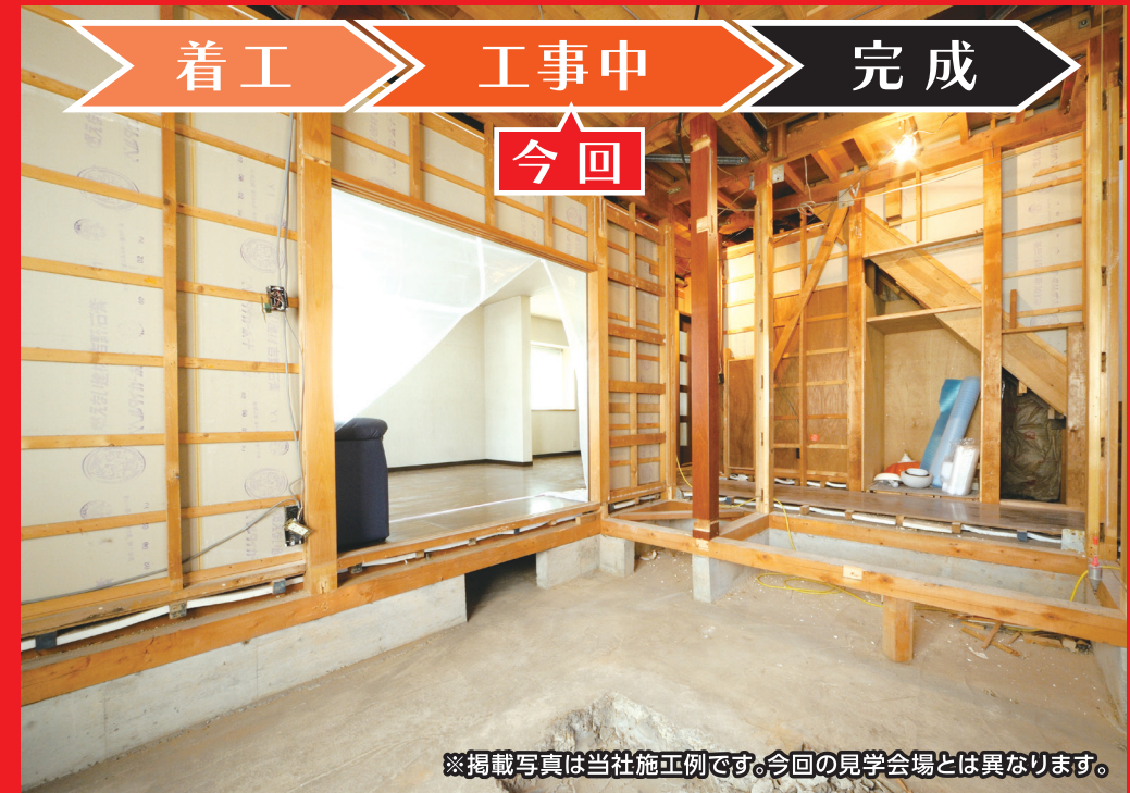
※掲載写真は当社施工例です。今回の見学会場とは異なります。