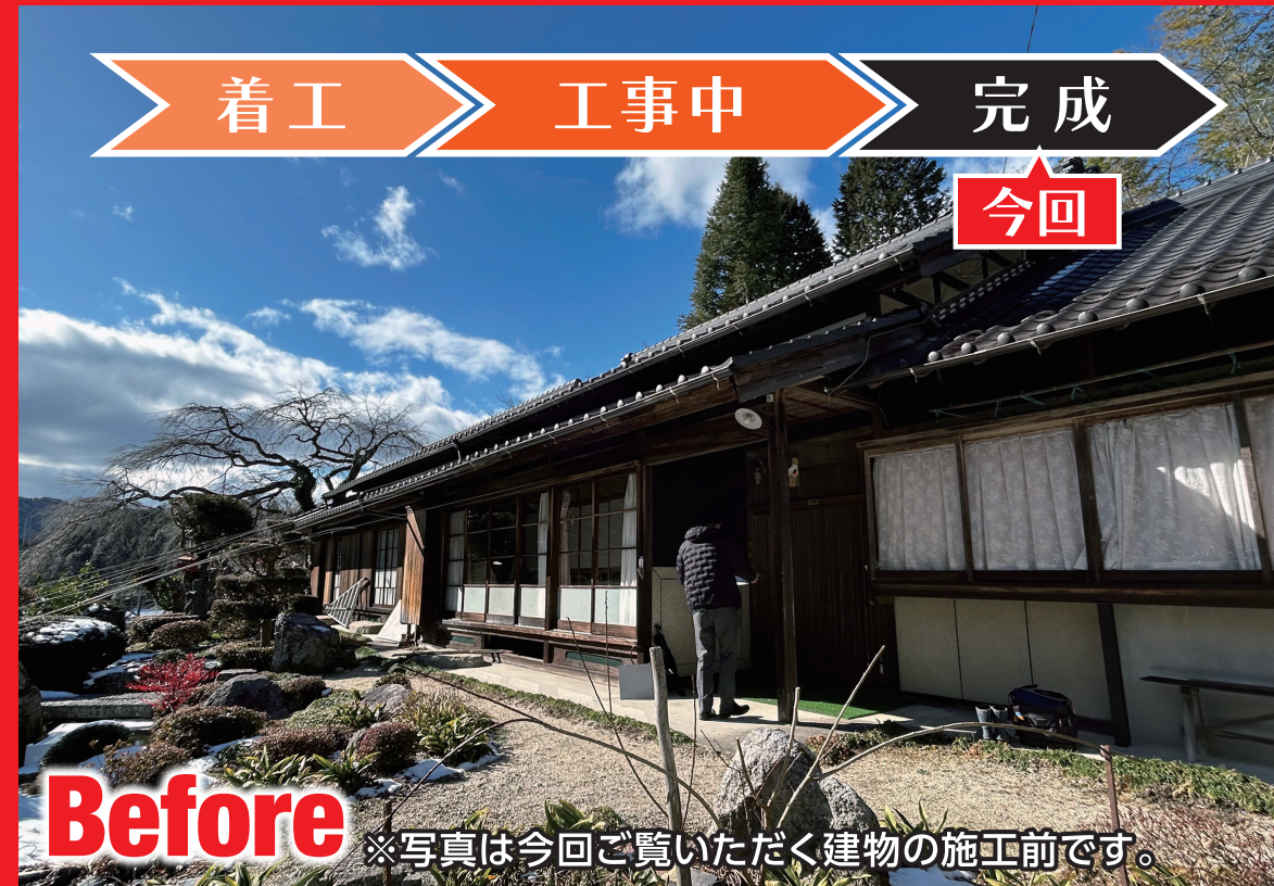
※写真は今回ご覧いただく建物の施工前です。