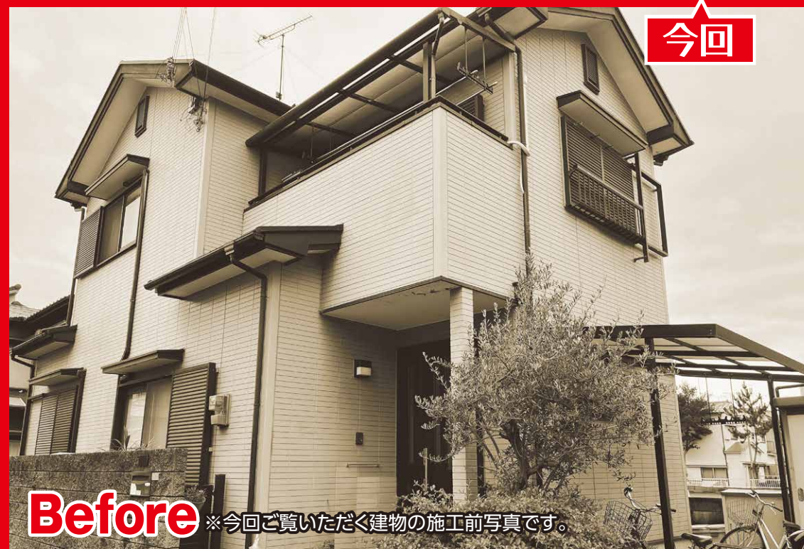
Before ※今回ご覧いただく建物の施工前写真です。