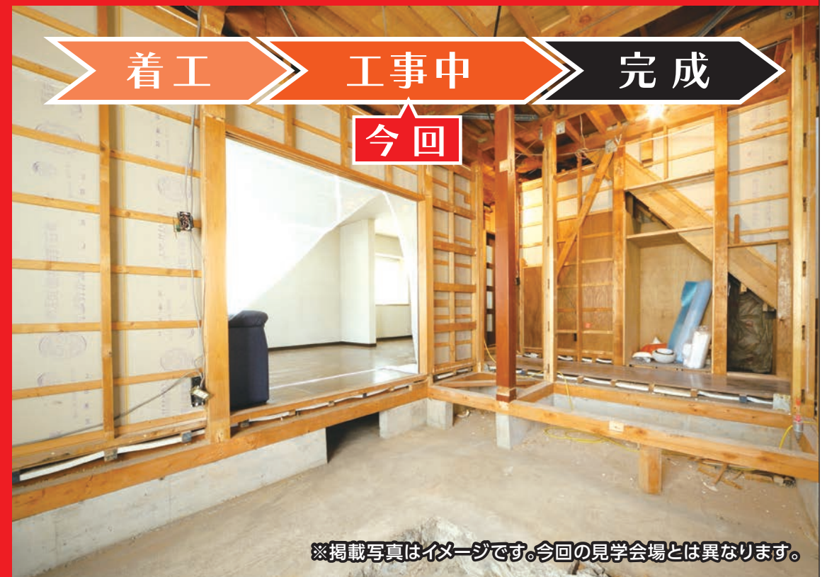
※掲載写真はイメージです。今回の見学会会場とは異なります。