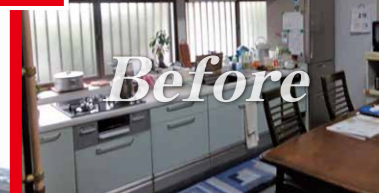
施工前 (当会場キッチン)