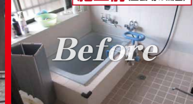
施工前 (当会場風呂)