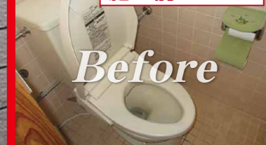
施工前 (当会場トイレ)