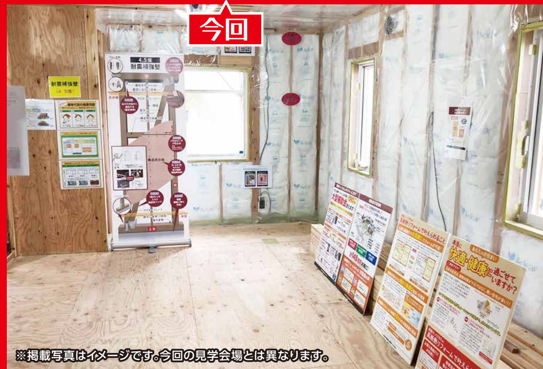
※掲載写真はイメージです。今回の見学会場とは異なります。