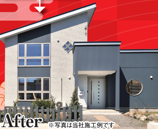
After ※写真は当社施工例です