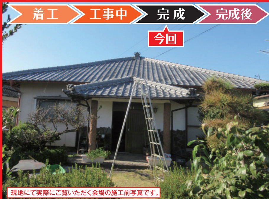
現地にて実際にご覧いただく会場の施工前写真です。