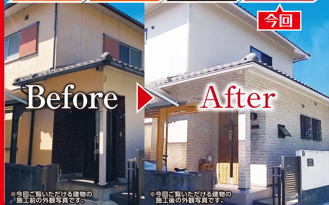
※今回ご覧いただける建物の施工前の外観写真です。