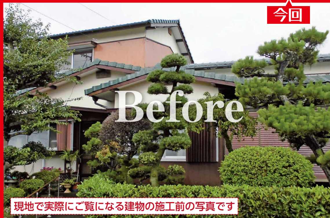
現地で実際にご覧になる建物の施工前の写真です