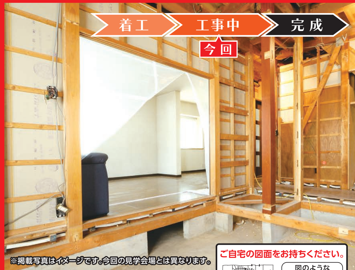
※掲載写真はイメージです。今回の見学会場とは異なります。

アパート併用部住宅を三世帯住宅に 間取り変更中です。(フルリノベーション中!!) 当日は、耐震補強工事と断熱工事の 様子をご覧いただけます。