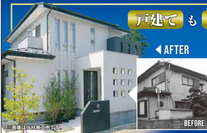
※画像は当社施工例です。