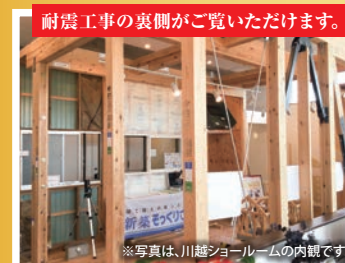
耐震工事の裏側がご覧いただけます。