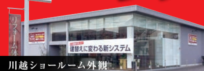
川越ショールーム外観