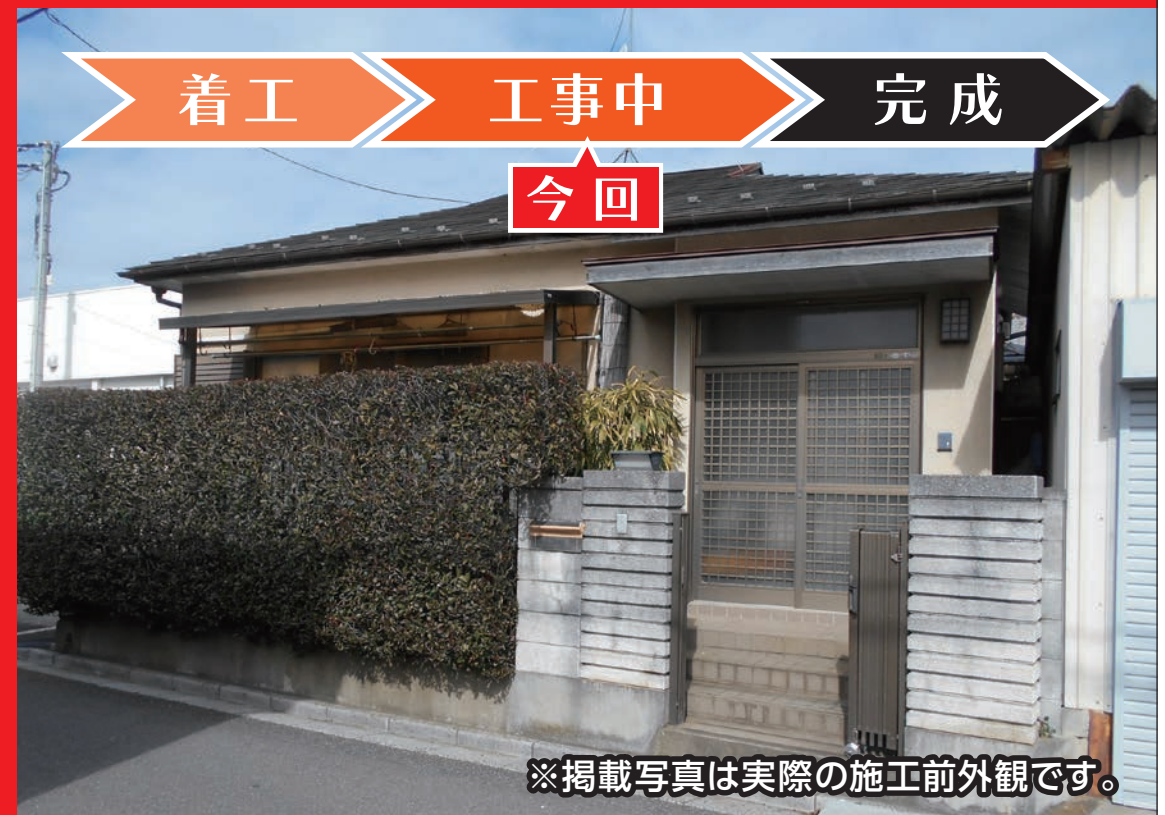
※掲載写真は実際の施工前外観です。