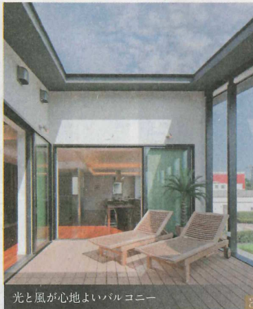
光と風が心地よいバルコニー