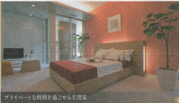
プライベートな時間を過ごせる主寝室