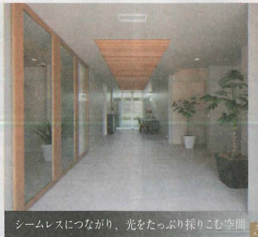
シームレスにつながり、光をたっぷり採りこむ空間