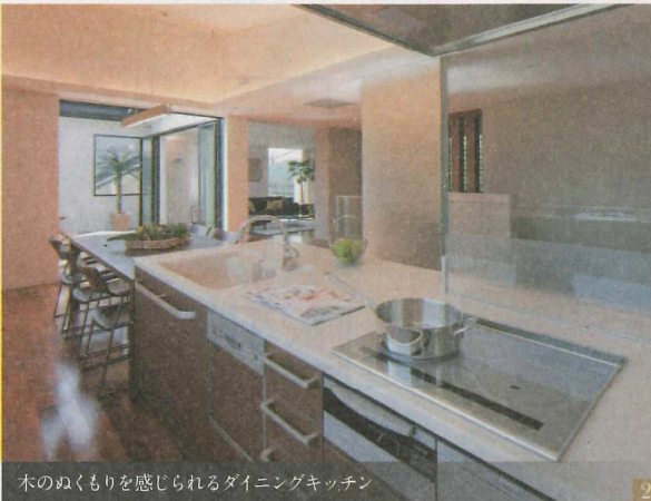
木のぬくもりを感じられるダイニングキッチン