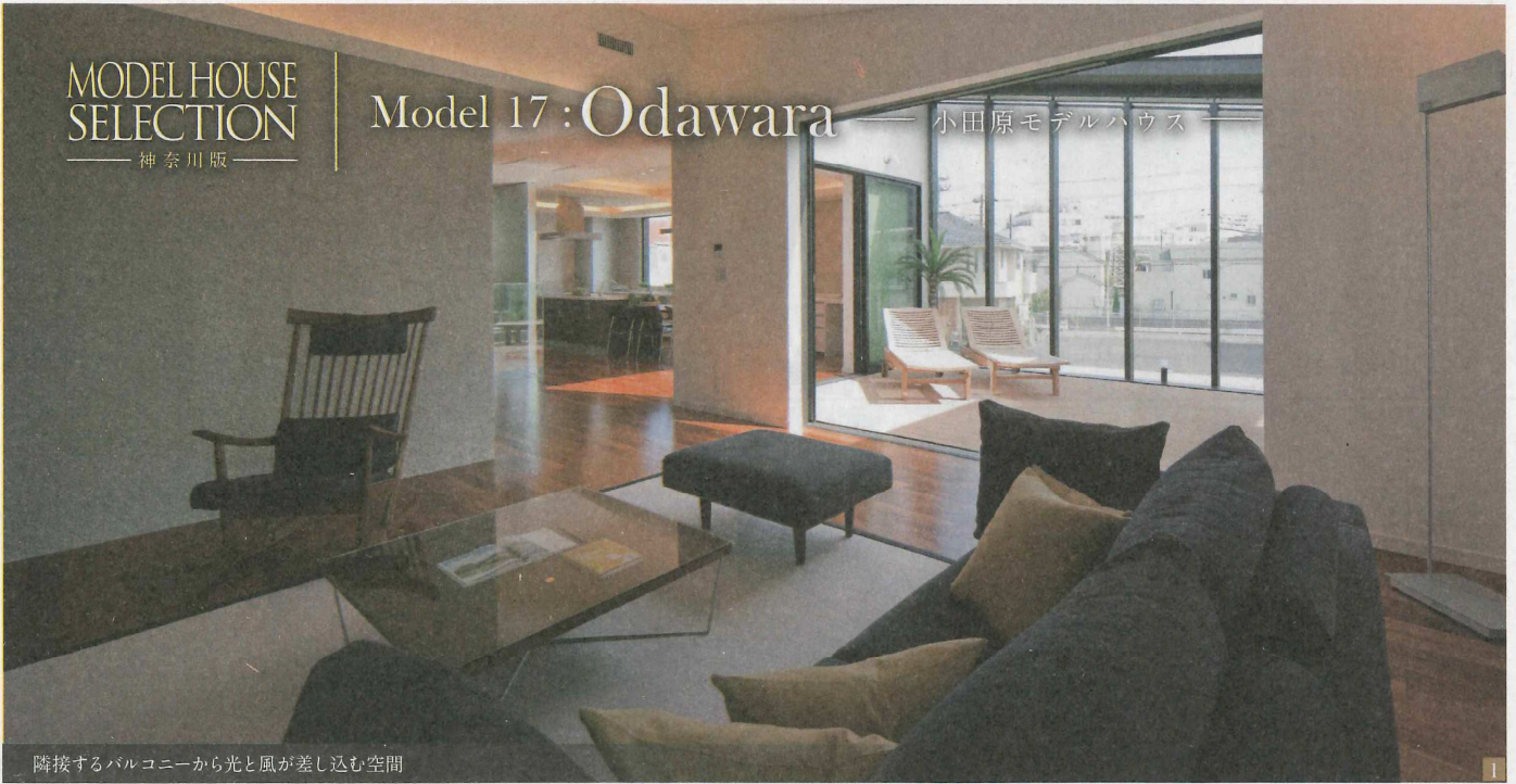
隣接するバルコニーから光と風が差し込む空間

空へと開かれ、街に対してゆるやかに仕切られたルーフバルコニーとそこから連なるボーダーレスなリビングとダイニング。