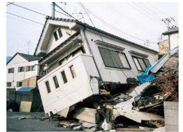
阪神・淡路大震災で倒壊した家屋