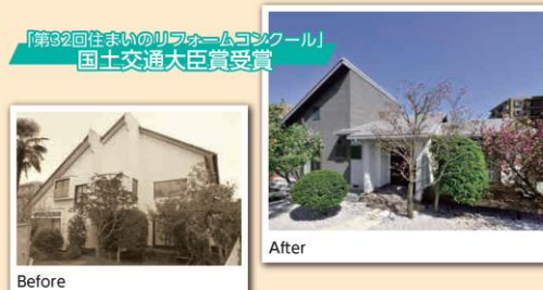
「第32回住まいのリフォームコンクール」 国土交通大臣賞受賞