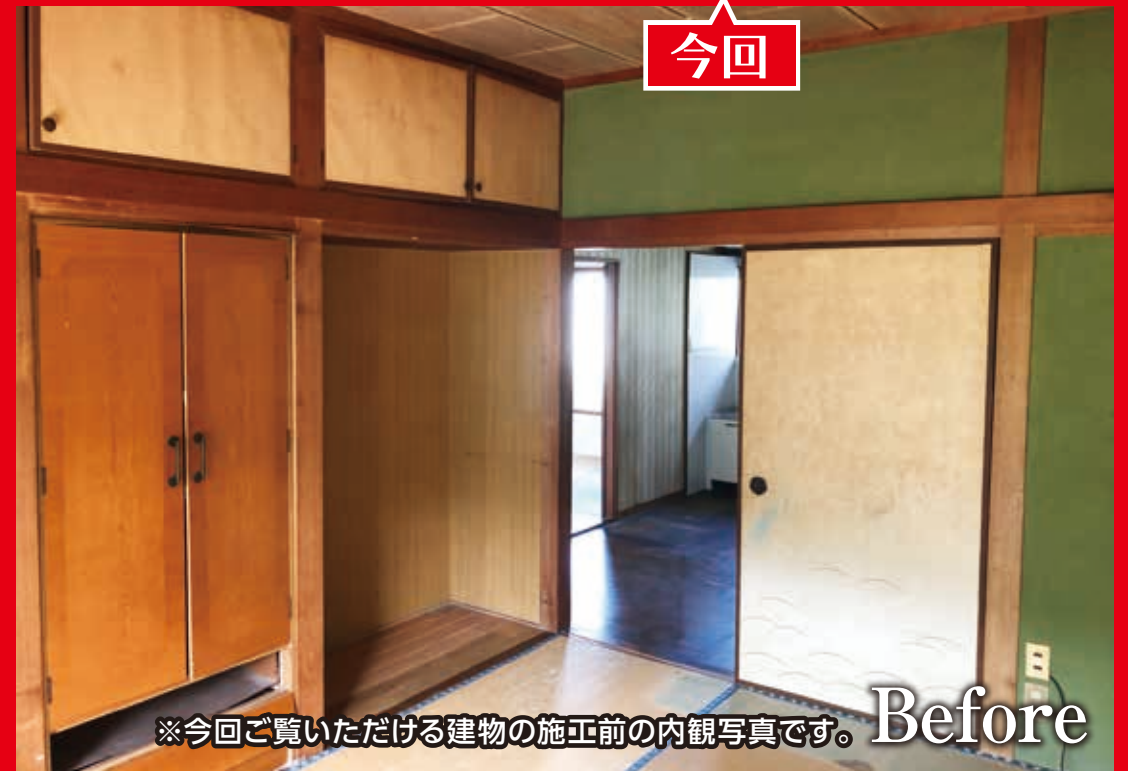
※今回ご覧いただける建物の施工前の内観写真です。 Before