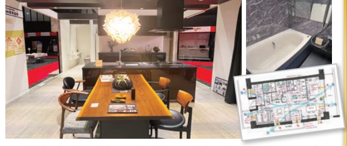
※分譲竣工時のデータの有無によって印刷出力できない場合もございます。※間取図はイメージ ※1 アスベスト使用の可能性がある場合のアスベストサンプリング分析調査は有料となります。