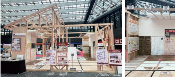
※地盤調査、アスベストのサンプリング分析調査は有料となります。